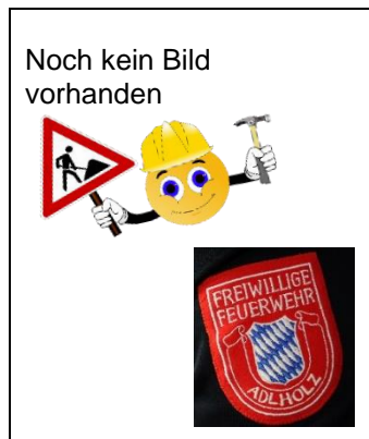
Simon Härtl Oberschalkenbach 4 92256 Hahnbach Tel. 09662 / 8436